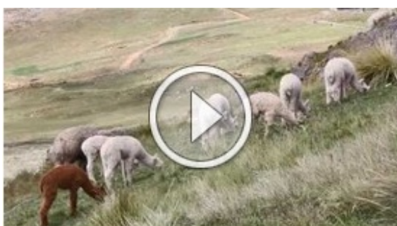
II Seminario Nacional "Competencias certificadas: calidad en el desempeño"