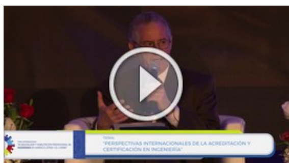
Foro Internacional "Acreditación y Habilitación profesional de ingeniería en América Latina y el Caribe"