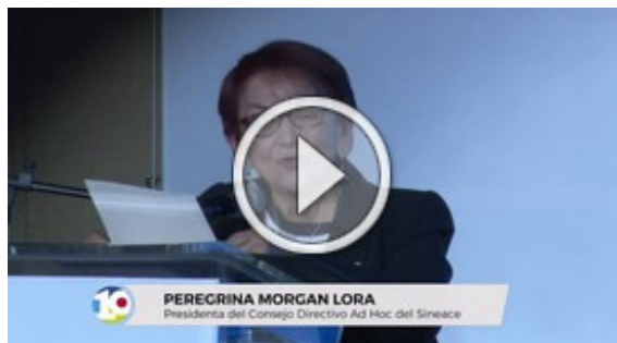
Lanzamiento de la década del Sineace