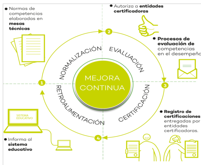
Figura N.º 1: Etapas del proceso de certificación

El proceso de certificación de competencias consta de cuatro etapas, desde la normalización de la ocupación hasta el proceso de retroalimentación a la persona evaluada.