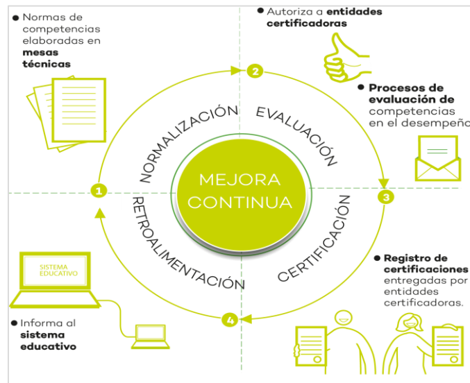
Figura N.º 1: Etapas del proceso de certificación

El proceso de certificación de competencias consta de cuatro etapas, desde la normalización de la ocupación hasta el proceso de retroalimentación a la persona evaluada.