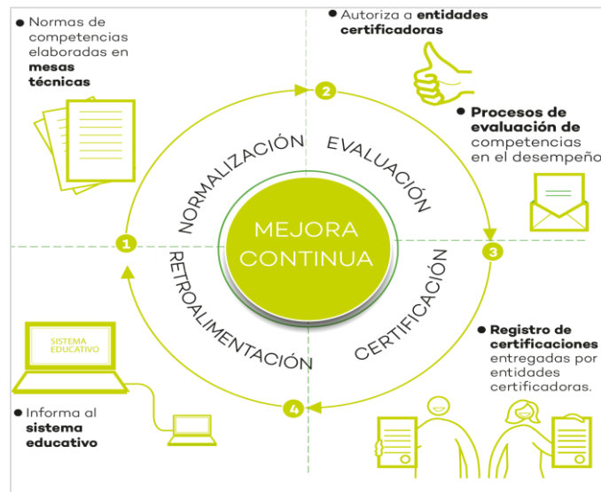
Figura N.º 1: Etapas del proceso de certificación

El proceso de certificación de competencias consta de cuatro etapas, desde la normalización de la ocupación hasta el proceso de retroalimentación a la persona evaluada.