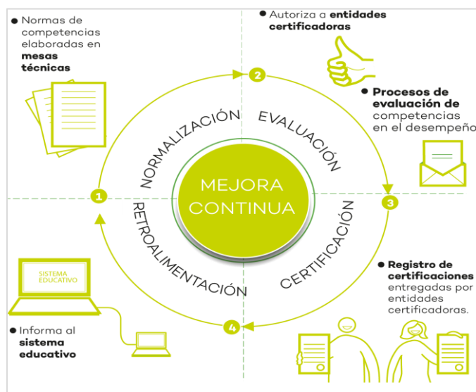
Figura N.º 1: Etapas del proceso de certificación

El proceso de certificación de competencias consta de cuatro etapas, desde la normalización de la ocupación hasta el proceso de retroalimentación a la persona evaluada.